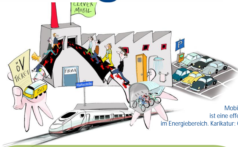
Betriebliches Mobilitätsmanagement ist eine effektive Massnahme im Energiebereich. Karikatur: Corinne Bromundt